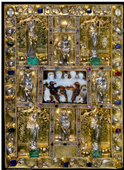
Ada-Evangelium, Teil der Handschriften aus der Hofschule Kaiser Karls des Großen. Sie zählen zu den bedeutendsten illuminierten Handschriften aus frühmittelalterlicher Zeit.