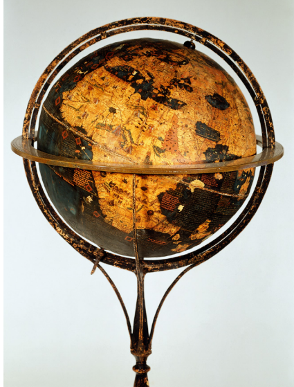
Behaim Globus, ältester Globus der Welt, der 1492–1494 entstanden ist. Er zeigt noch nicht Amerika. © Germanisches Natio- nalmuseum, Nürnberg