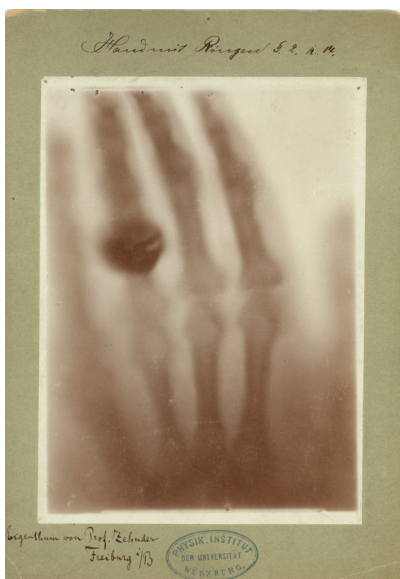
Röntgenaufnahme der Hand von Anna Bertha Röntgen 1895