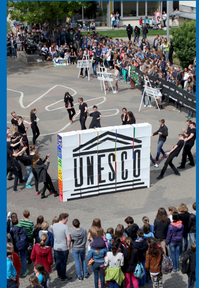
Titelbild: Performance zum UNESCO-Projekttag der Humboldtschule, UNESCO-Projektschule in Bad Homburg