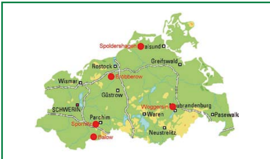
An der Studie teilnehmende Dörfer

Alle heute bestehenden deutschen Biosphärenreservate liegen im ländlichen Raum. Sie sind daher in unterschiedlicher Intensität von übergreifenden demographischen Entwicklungen wie Alterung, Landflucht und Geburtenrückgang betroffen. Zur Lösung demographischer Probleme wird deutschlandweit meist stärkere Förderung der Wirtschaft vorgeschlagen. Dass dieser Ansatz zu kurz greift, zeigt eine Studie über demographisch erfolgreiche Dörfer in Mecklenburg-Vorpommern.