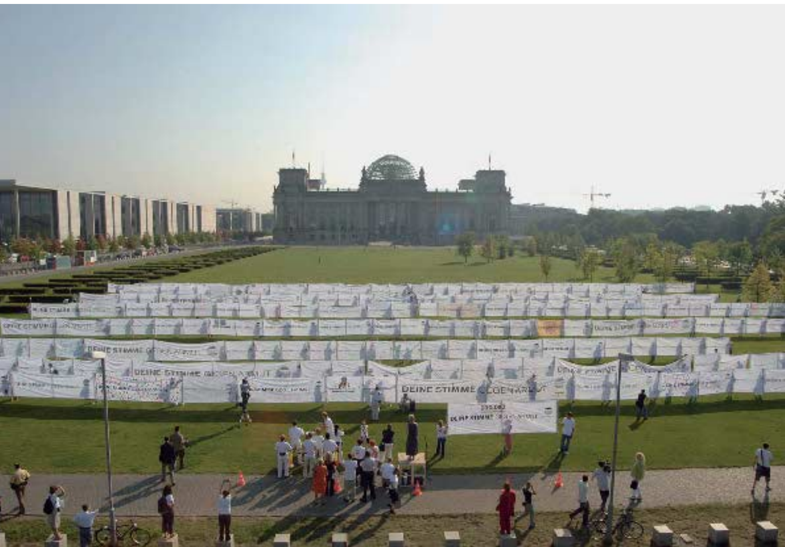
Aktion zum 2. White Band Day "Deine Stimme gegen Armut" am 9. September 2005 vor dem Reichstag in Berlin