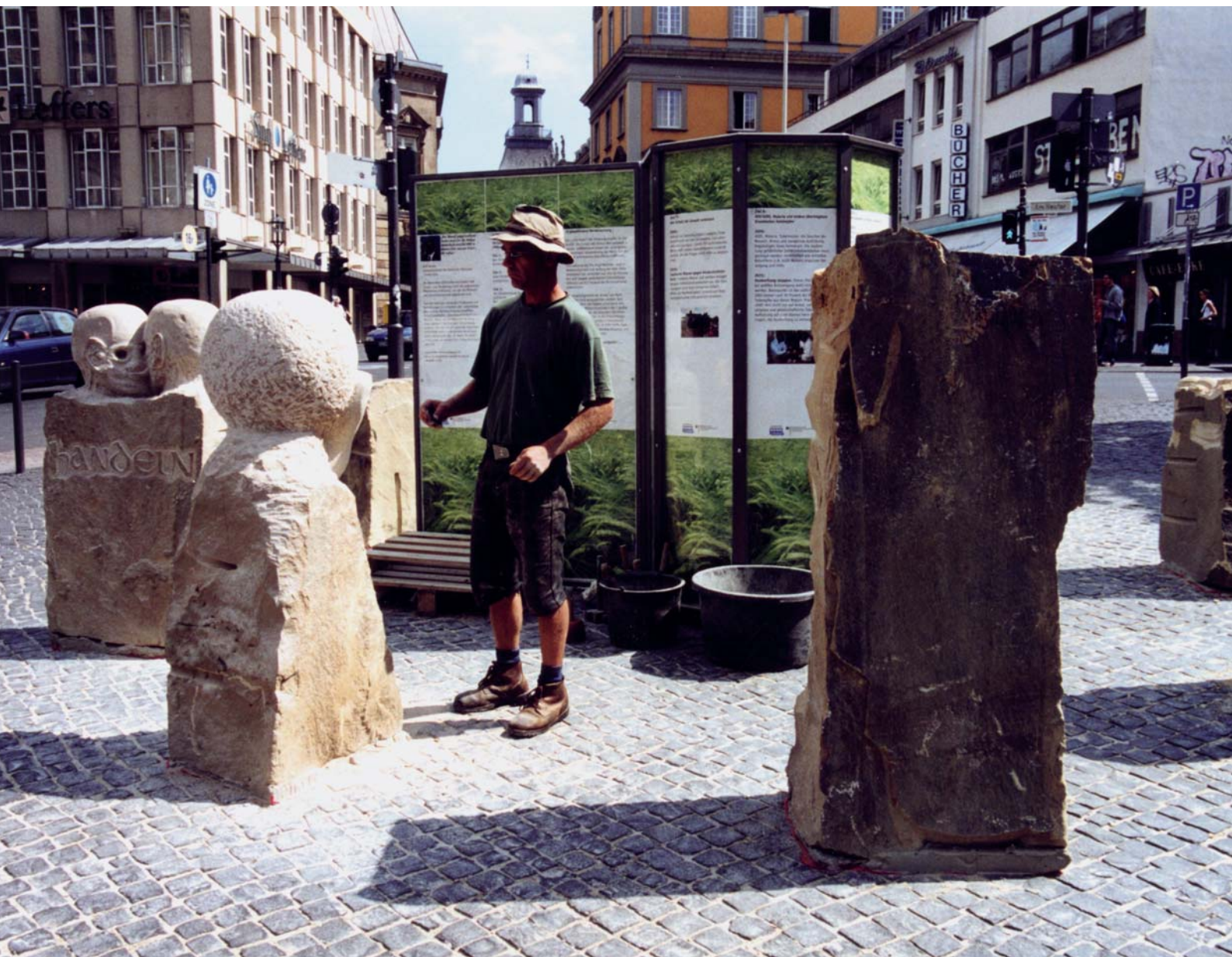
Die Bonner Millenniumssteine