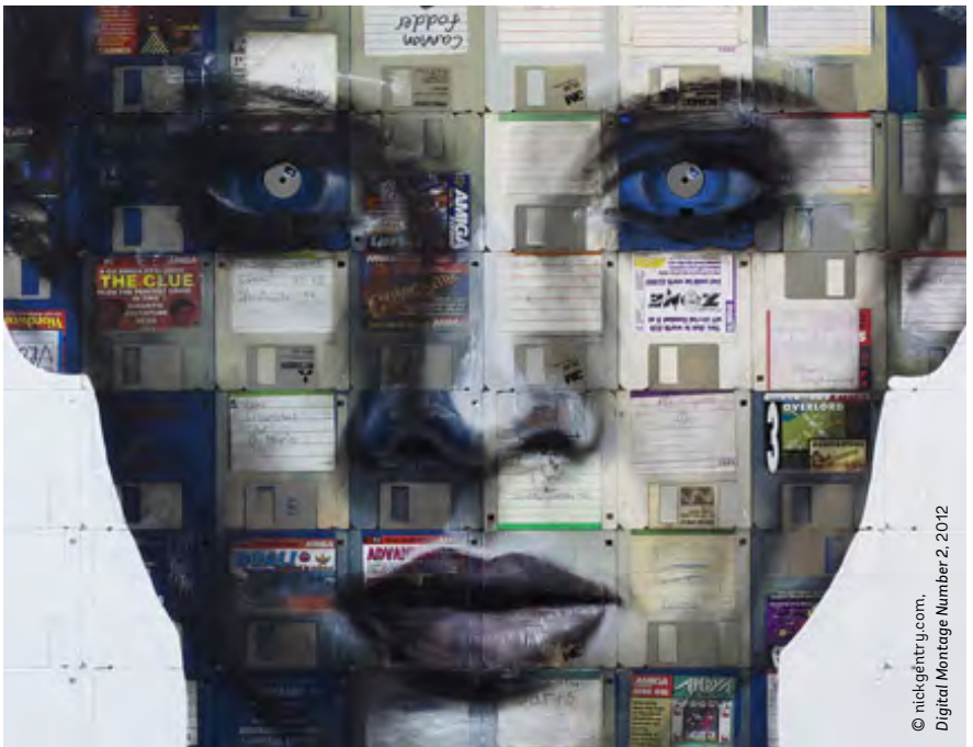
© nickentry.com, Digital Montage Number 2, 2012